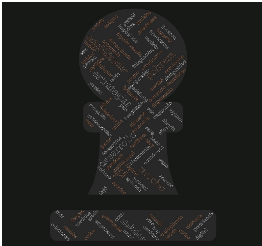
Figura 2. Nube de palabras Política Social PND 2019-2024

Fuente: Elaboración propia, con base al PND 2019-2025, Política social, construir un país con bienestar. pp. 34-37.