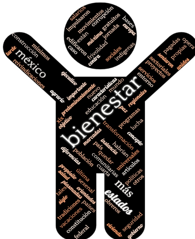
Figura 3. Nube de palabras Política Social PND 2019-2024

Fuente: Elaboración propia, con base al PND 2019-2025, Política social, construir un país con bienestar. pp. 34-37.