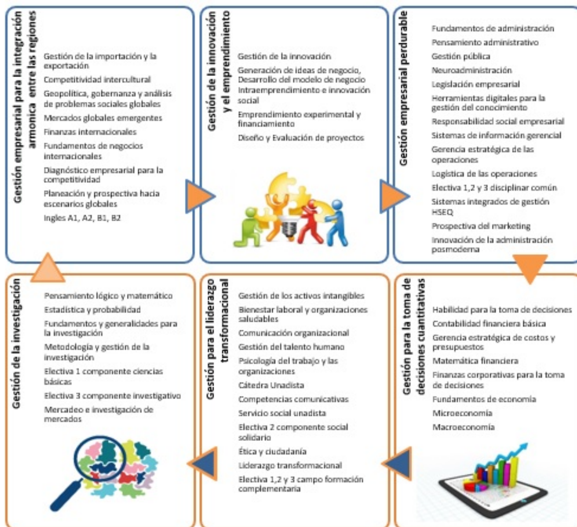
Figura 2. Redes y cursos propuestos en el programa