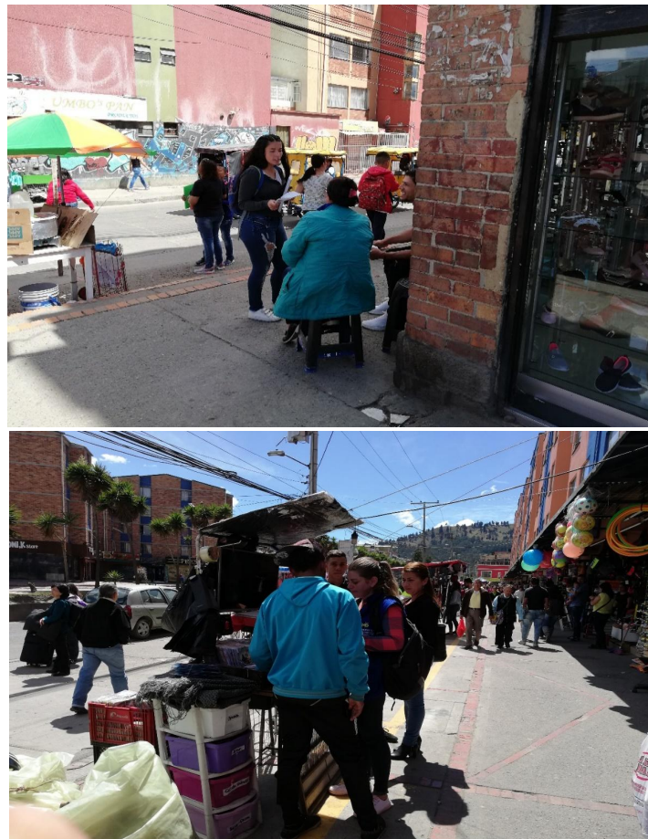
Figuras 1, 2 y 3. Ejemplos de una carreta, ventas en suelo y mesa en el espacio público

Los profesionales en seguridad y salud en el trabajo se organizaron con una cuidadosa logística, y cubrieron toda la zona de ventas ambulantes. En grupos de dos personas abordaban a los vendedores en momentos que no estuvieran ocupados; para ello se escogieron días y horarios en los que la actividad de ventas era baja. Las imágenes 8 y 9 muestran a los profesionales interactuando con la población objeto de estudio.