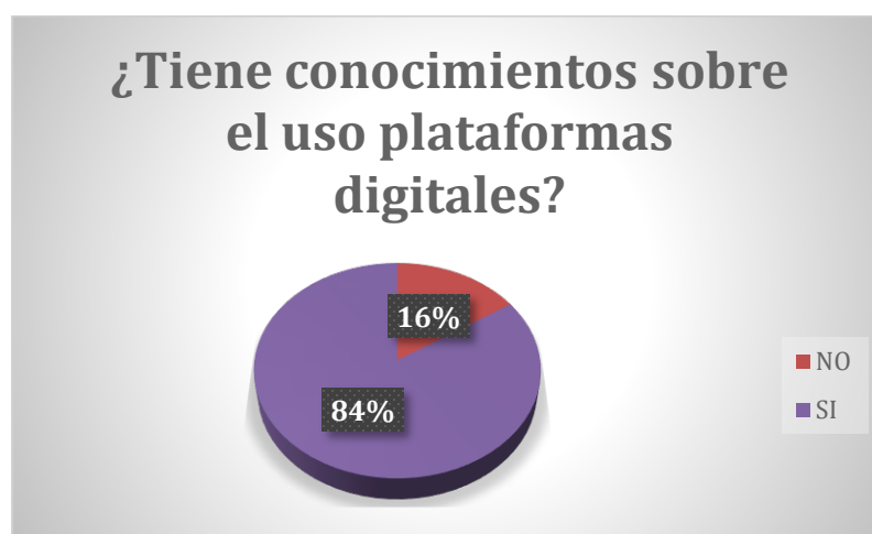
Figura 3. ¿Tiene conocimientos sobre el uso de plataformas digitales?

En cuanto al análisis con respecto a los diversos métodos de enseñanza dependientes a la necesidad de recursos tecnológicos; se ha logrado observar los distintos niveles de conocimiento, habilidades y requerimientos por parte del personal administrativo y docente de los diferentes CDI's.