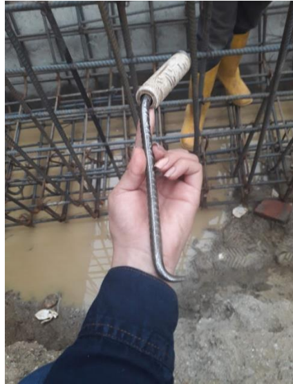
Figura 31. Bichiroco con Balinera.

Después de este análisis se propone el diseño de accesorio para la herramienta utilizada en la actividad de amarre de acero, disminuyendo el movimiento rotatorio repetitivo en la articulación de la muñeca y manos del personal.