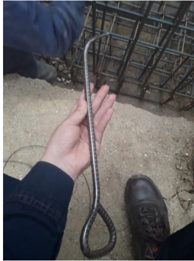
Figura 2. Bichiroco sencillo.

El segundo es una varilla calibre \frac{1}{2} ", con 50 cm de largo, a la cual en uno de sus extremos le realizan una curva con un ángulo de 80^\circ , a su vez por medio del disco de una pulidora pasan este extremo de la varilla para generar un desgaste en la misma creando así una punta con un diámetro menor, con la cual logran generar el agarre del alambre, pero la diferencia de este bichiroco con balineras al bichiroco sencillo es que en el otro extremo en lugar de realizarle las tres curvas, la introducen dentro de un tubo PVC de \frac{3}{8} pulgadas y un tubo exterior de PVC de \frac{1}{2} " con 15 cm de largo, al cual le ubican en cada extremo un par de balineras junto con tuercas cada una para evitar que las balineras se salgan de su lugar la cual permite que gire la punta del bichiroco con mayor facilidad. (Personal de amarre).