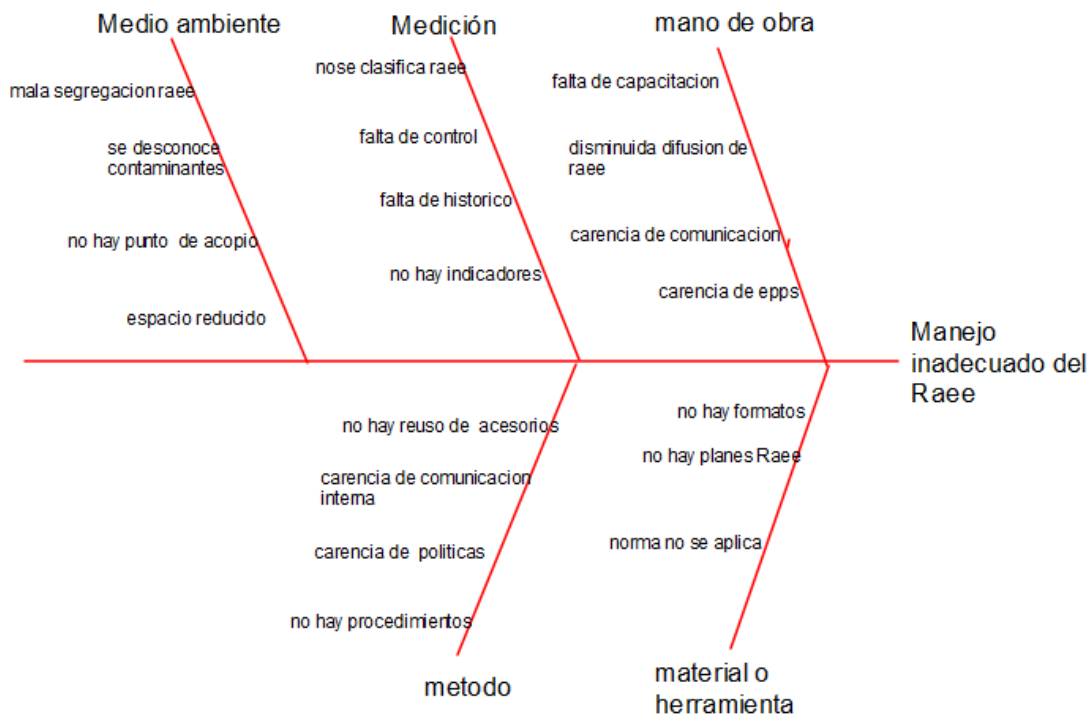
Figura 2. Diagrama de Ishikawa del manejo inadecuado del RAEE en la empresa

De la anterior figura 2, se determina que las principales causas: falta de clasificación correcta de los RAEE, falta de capacitación y difusión sobre el manejo adecuado del RAEE, falta de almacén adecuado para los RAEE, mala segregación y disposición de los AEE, falta de control de los inventarios de los equipos utilizados y dados de baja.