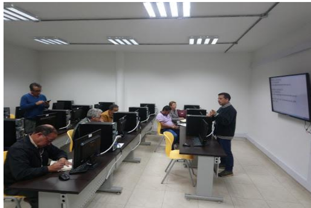
Figura 3. Sensibilización RAEE

En dicha jornada, en las 2 guardias, participaron activamente personal de logística, operadores involucrados, técnicos y supervisores.